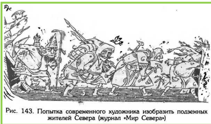
Рис. 143. Попытка современного художника изобразить подземных жителей Севера (журнал «Мир Севера»)